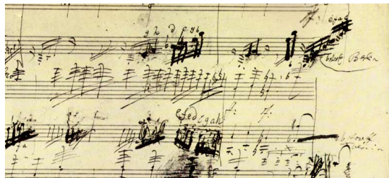
(autografo dell'op. 111)